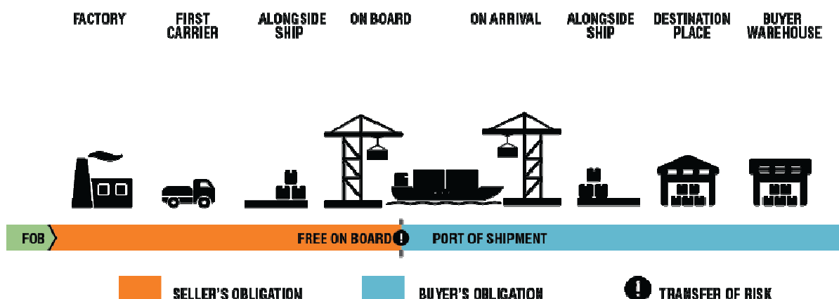
Slika 1: Grafični prikaz primera FOB